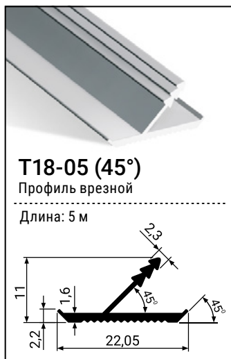
Схема установки профиля

Профиль T18-05 используется для изготовления фасадов из ДСП, МДФ, массива и т.п. толщиной 16-18 мм. При изготовлении фасада с использованием профиля T18-05 в плите должен быть подготовлен соответствующий паз. При сборке фасада рекомендуется использовать монтажный клей.